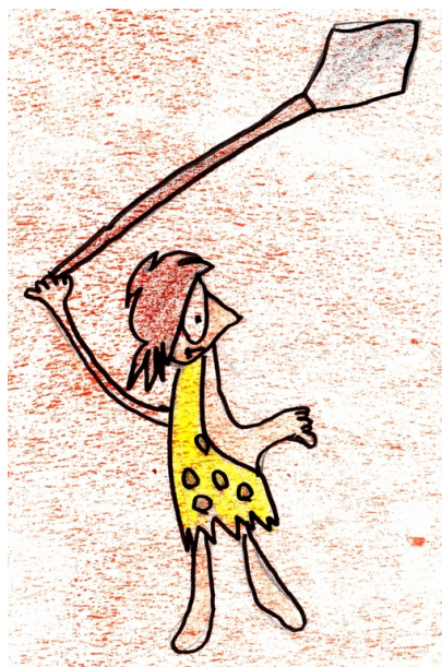
Le spectacle CE1 Merxheim