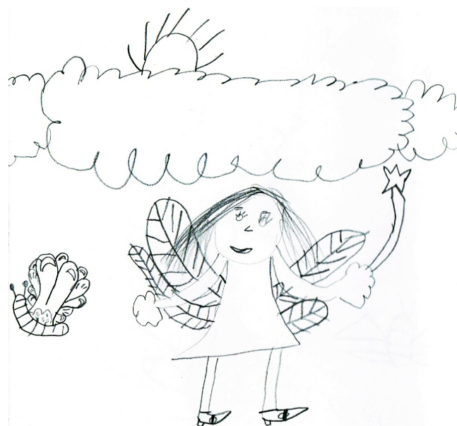
Charlotte CP Ecole d'Aspach le Bas

Bien sûr, ils ont réclamé de recommencer pour la poésie suivante et consultent régulièrement ces livres pendant leur temps libre.